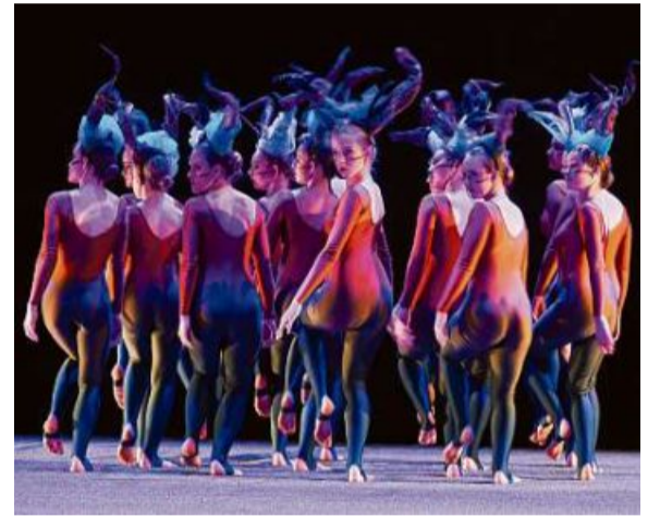
70 Minuten äusserste Anspannung: Tanzschülerinnen aus Graubünden und St. Gallen führen im Theater Chur das komplexe Tanzstück «Pure» auf.